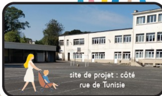
site de projet : côté rue de Tunisie