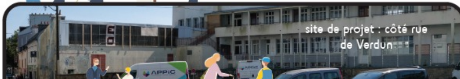
site de projet : côté rue de Verdun